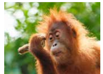
Orang = „Mensch“ Utan = „Wald“

Auf der Insel Borneo leben die letzten großen Menschenaffen, die Orang-Utans, in freier Wildbahn. Aber auch die bedrohten Zwergelafanten, eine seltene Unterart der Waldelefanten, und das malaysische Wappentier, der Nashornvogel, leben dort.