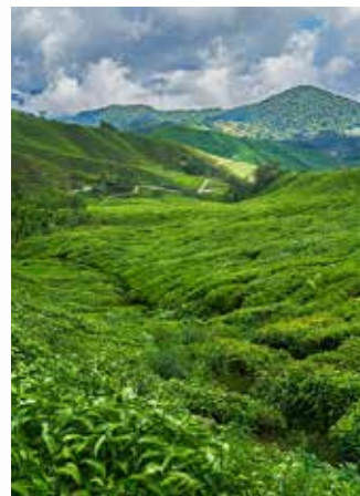
Bergische Landschaft in Malaysia