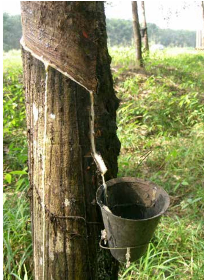
Milchsaft (Latex) des Kautschukbaumes

Auf den Forstplantagen findet man überwiegend Palmöl-pflanzen. Malaysia exportiert pro Jahr mittlerweile rund 17 Millionen Tonnen Palmöl. Das macht ein Drittel des welt-weiten Marktes aus. In Malaysia gibt es um die 4,5 Millionen Hektar reine Palmölplantagen. Weltweit sind es 17 Millionen Hektar. Palmöl findet man in vielen Nahrungsmitteln und Kosmetika. Obwohl es sich um einen nachhaltigen Rohstoff handelt, ist die Ver-