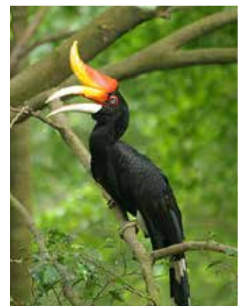
Nashornvogel ( Buceros rhinoceros )