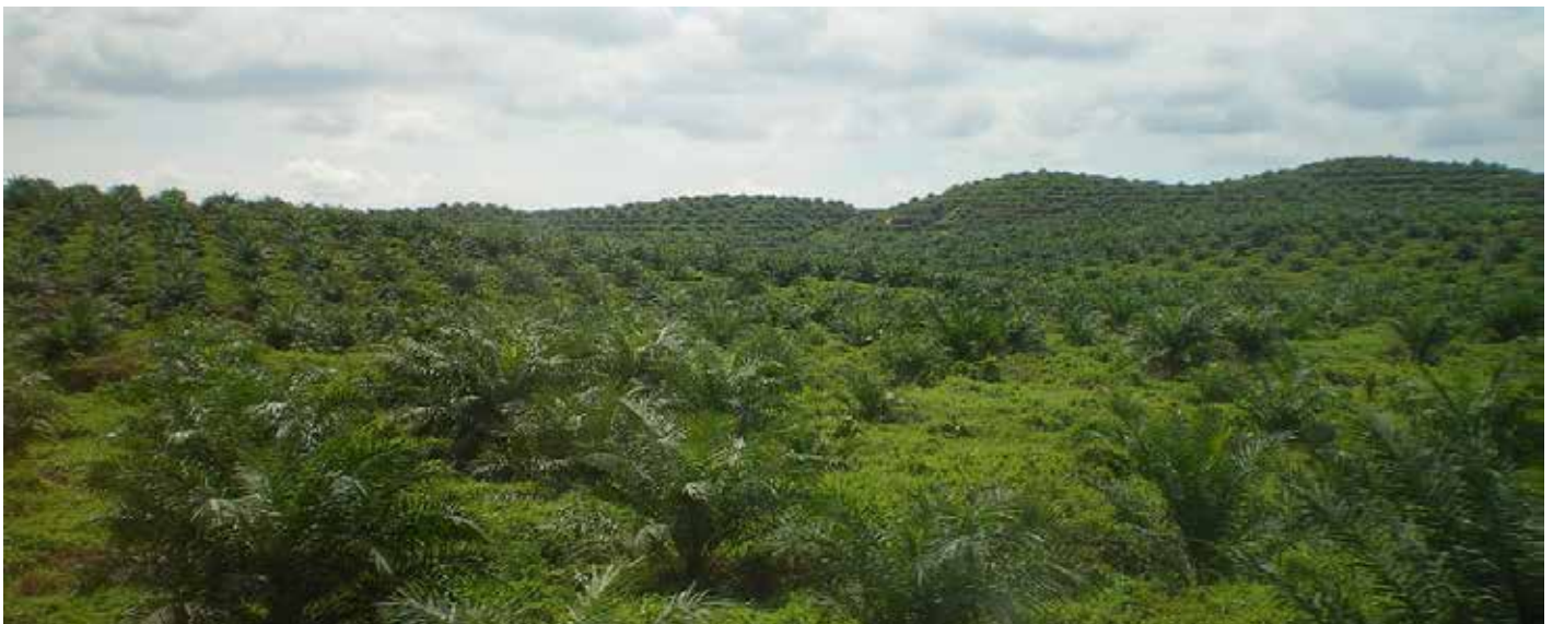
Palmölplantage in Ost-Malaysia

M alaysia ist ein vielfältiges Land. Es gehört zu den 17 sogenannten Ländern der Mega-Biodiversität weltweit. Das bedeutet, dass in diesen Ländern so viele verschiedene